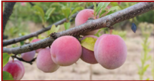
Щедрый урожай фруктов