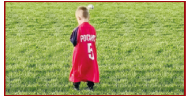
Кубок области: алешкинцы в финале